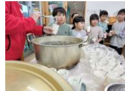
七草がゆで健康祈願