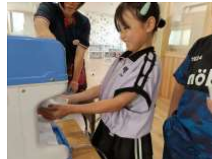
かき氷も自分たちで